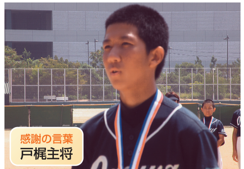
感謝の言葉 戸梶主将

猛暑の中、会場周辺は大変な熱気かと思われました。大会期間中、心配された熱中症の発生は無かった模様で一安心。