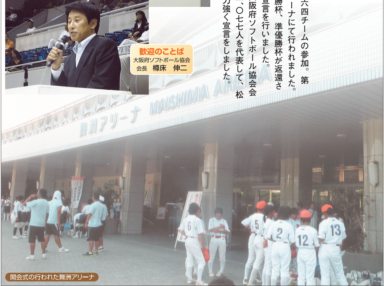
開会式が行われた舞洲アリーナ