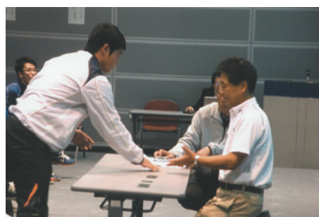
抽選会風景 競技委員会