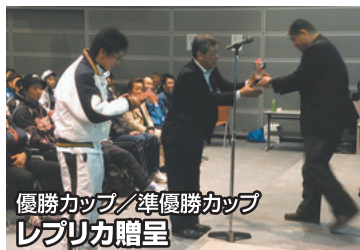
優勝カップ/準優勝カップ レプリカ贈呈